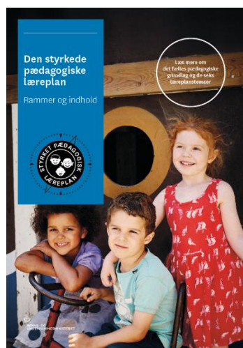
Den styrkede pædagogiske læreplan. Rammer og indhold

Denne skabelon indeholder alle de lovmæssige krav til evalueringen. Lovkravene finder I i de to midterste afsnit "Evaluering og dokumentation" og "Inddragelse af forældrebestyrelsen". Skabelonen indeholder desuden spørgsmål, som kan støtte jeres evalueringsproces samt jeres fremadrettede arbejde med løbende at revidere den skriftlige læreplan.